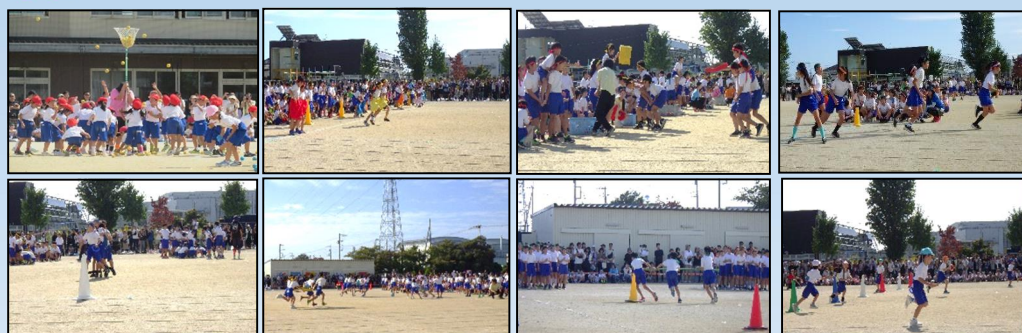
力を合わせて協力した 団体競技