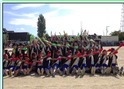
6年生 表現 「幸房ソーラン 2025」