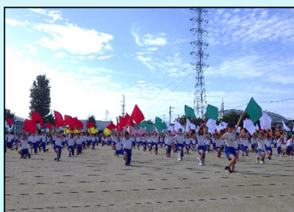
5年生 表現 「We are～七つのflagをもつ者たち～」