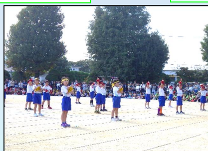
2年生 表現 「かっこかわいく元気いっぱい！2年は最強！」