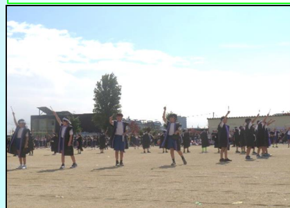
4年生 表現 「チャレンジ！ダイナミック幸房」