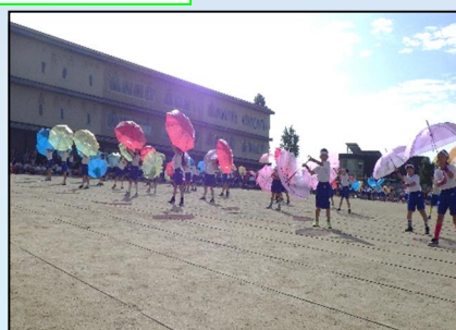
3年生 表現 「ようこそ！レインボーアンプレラの世界へ」