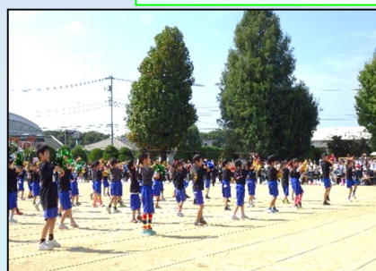
1年生 表現 「かわいいだけじゃおわらない！ 261人のスマイルハッピーパーティー㊤」